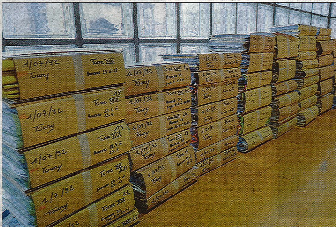
SIX ANS D'ENQUÊTE. Le mur de dossiers, 83 tomes, était impressionnant dans la salle d'audience du tribunal correctionnel de Clermont-Ferrand où s'est déroulé le procès fin novembre.

Le jugement vient d'être rendu public. Leurs deux clients, absents hier, sont reconnus coupables du délit de banqueroute par emploi de moyens de fraudeux, faux et usage de faux, présentation de comptes inexacts et répartition de dividendes fictifs. Ce n'est pas une surprise compte tenu des aveux et des déclarations recueillis à la barre du tribunal lors des qua-