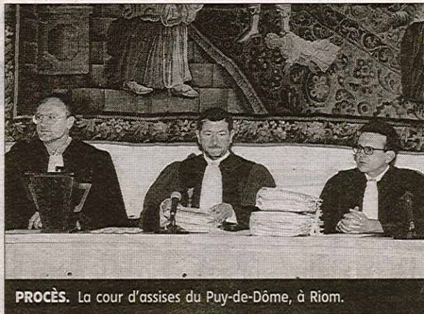
PROCÈS. La cour d'assises du Puy-de-Dôme, à Riom.